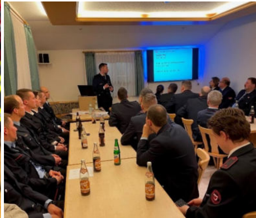
Versammlungsteilnehmer JHV 2023