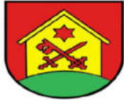
Gemeinde Hausen am Bussen