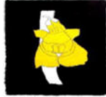
Förderverein Schwäbischer Dialekt e. V.