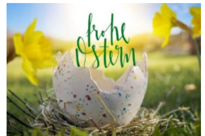
Uwe Handgrättinger, Bürgermeister