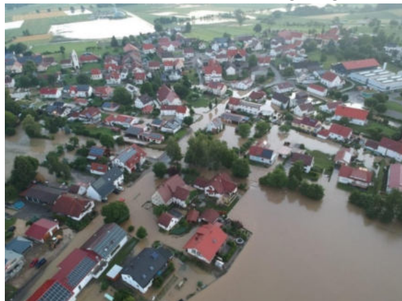
Bild: Luftbild Unterstadion am 24.06.2021, vergleichbar war auch die Ortsdurchfahrt Grundsheim überflutet.